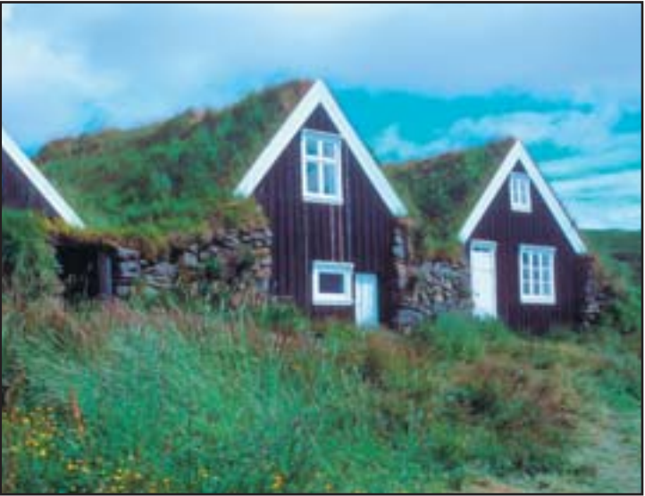
La ferme Sel, extérieur