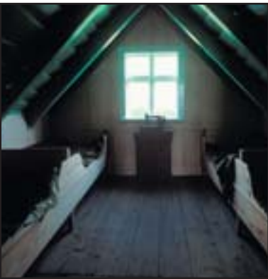
La ferme Sel, intérieur.

Skaftafell était naguère une ferme importante ainsi qu'un lieu de rassemblement. Très tôt elle devint propriété de l'église et ensuite du roi. Les bâtiments étaient naguère au pied des collines et on en voit encore les ruines près d'Eystragil, dans un site appelé Gömlutún. Les crues de la Skeiðará ont couvert peu á peu les anciens prés de sable et la ferme a été déplacée de 100 mètres sur le versant de la colline, dans les années 1830 á 1850.